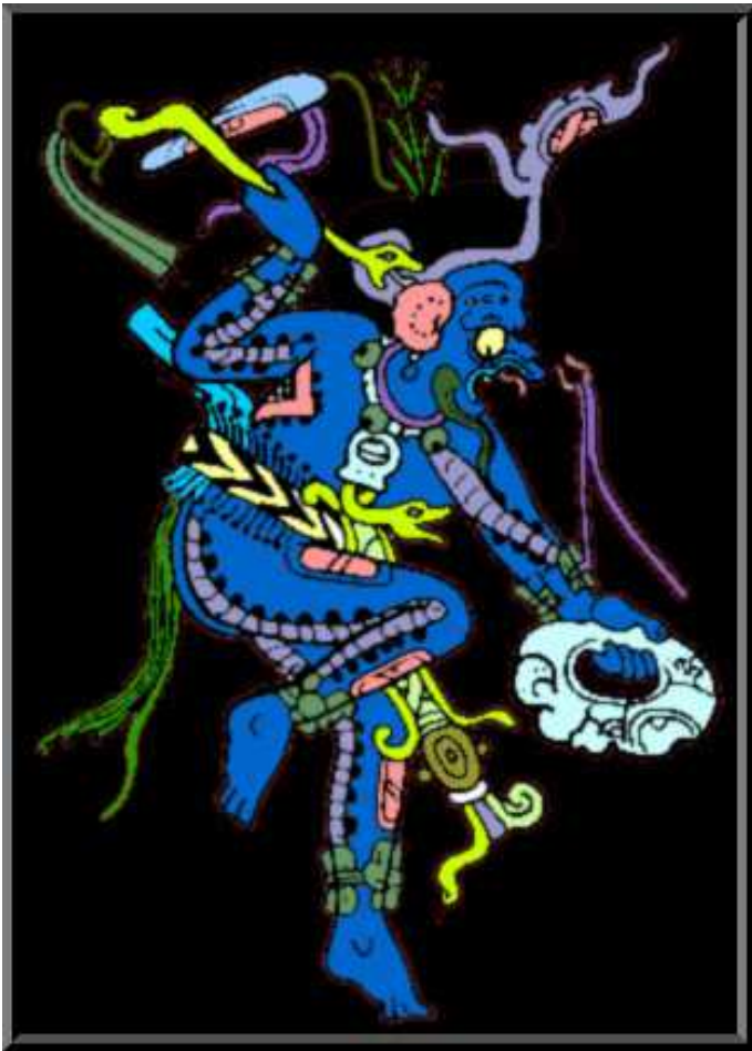
Na slici iznad: Majanski bog kiše i svjetlosti

Kur'an nam govori da su džinni stvoreni od bezdimnog plamena vatre - što znači od srži vatre. Zato, hajde zapalite plamen i videjet ćete da je srce vatre PLAVO. Džinni također žive hiljadama godina i putuju vrlo brzo (što objašnjava zašto sve drevne civilizacije imaju bogove koji izgledaju slično i makar je jedan od njih plav).