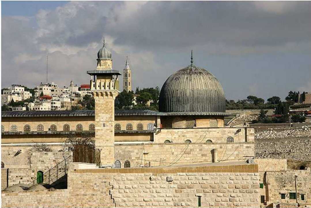
Jerusalem, Al-Aksa Mosque