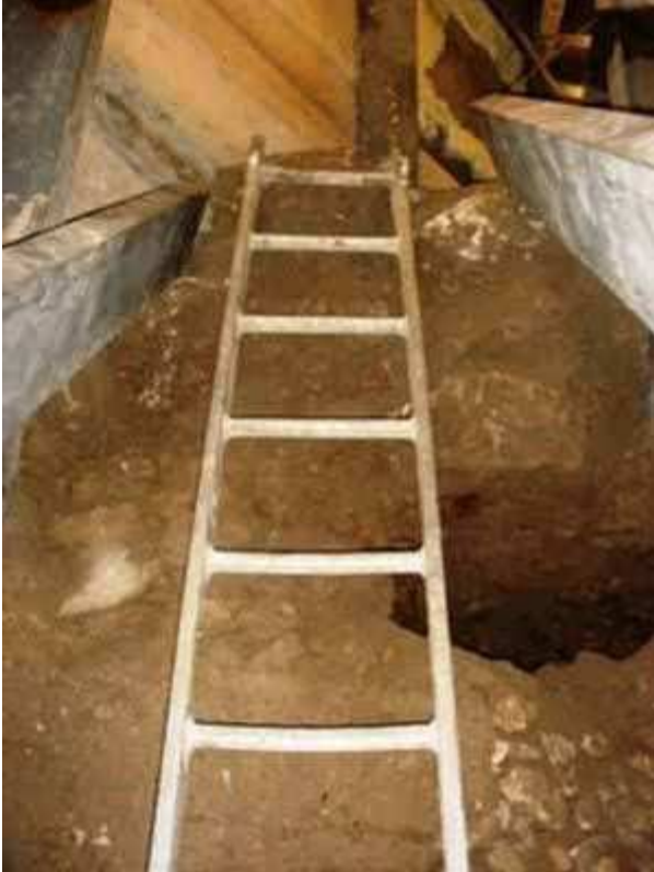
Iskopani prolaz ispod mesdžida El-Aksa.