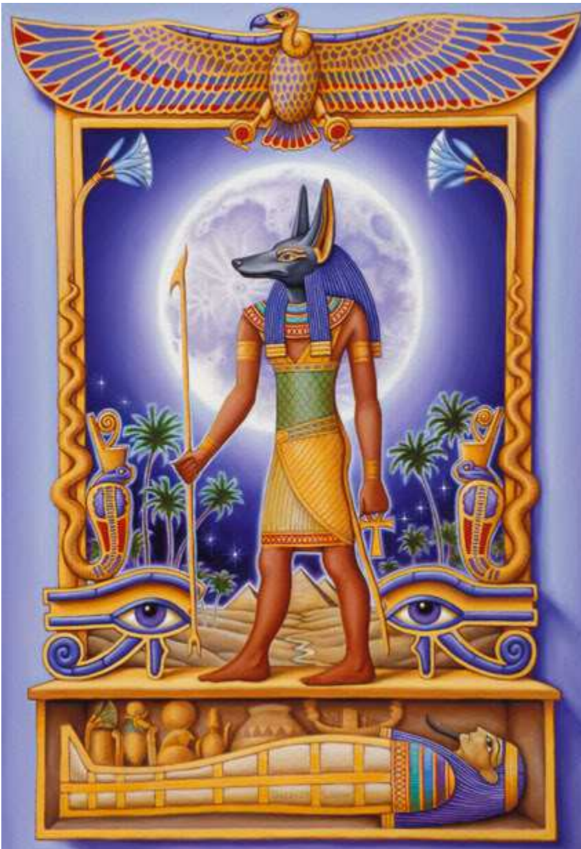
Na slici iznad: Antički egipatski “bog” Anubis

Pogledajte i nekoliko slika antičkih “bogova”.