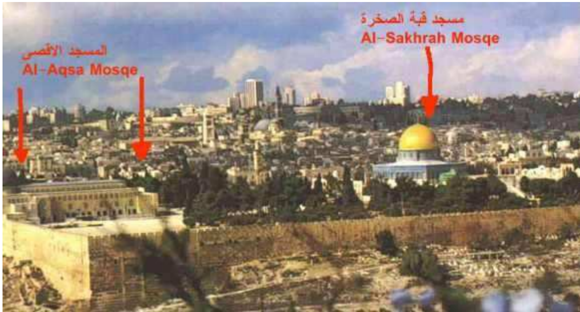
Pukotine u dvorištu i unutrašnjosti džamije El-Aksa. Primijetiti ćete da je u pozadini džamija Kubetus-Sahra.