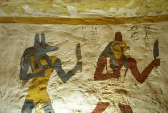
Na slici iznad: Još dva antička egipatska boga sa glavama u obliku psa i ptice